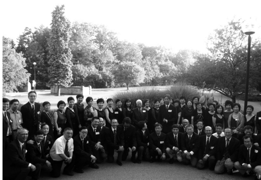
珊瑚禧聯歡會宴前先來個大合照