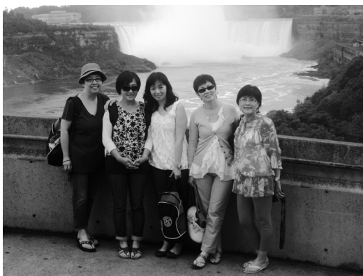
遊覽尼亞加拉瀑布