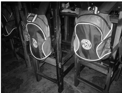
珊瑚禧紀念小書包

第二天一早，大家在錦繡中華前集合，乘坐旅遊車前往尼亞加拉瀑布遊覽。瀑布遊人很多，我們沿著瀑布旁的公園小徑緩步而行，尋找景點拍照，也互相暢談近況。旅遊車隨後載我們到酒莊午膳，在偌大的莊園旁進食美味的西餐，別有一番風味。餐後酒莊安排專人帶我們遊覽及作簡介，不過大伙兒對葡萄的生長興趣不大，都急不及待的走去試酒，無論紅酒、冰酒，都大受歡迎，試完又試，勝完可以再勝，至於最後有多少人購買則不得而知了。大家帶著酒意，乘車到瀑布旁的小鎮Niagara-on-the-Lake area參觀。有些同學可能曾經來訪，所以選擇留在車裡小休，另有些同學則在附近的公園裡休憩，我和幾位同學信步瀏覽。這裡是一個以遊客為主的歐陸式小鎮，大路兩旁都是商店，出售各種紀念品，定價可不便宜。其中由美女駕駛的馬車最受遊客歡迎，很多人排隊乘搭，欣賞小鎮風光。我們隨後乘車返回多倫多