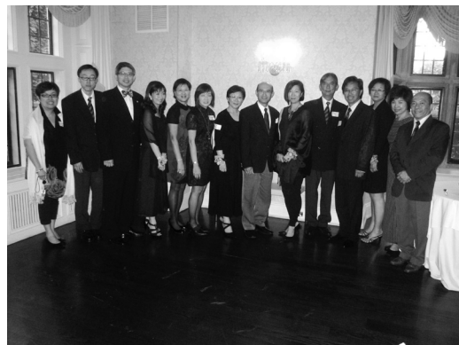
勞苦功高的珊瑚禧活動籌委