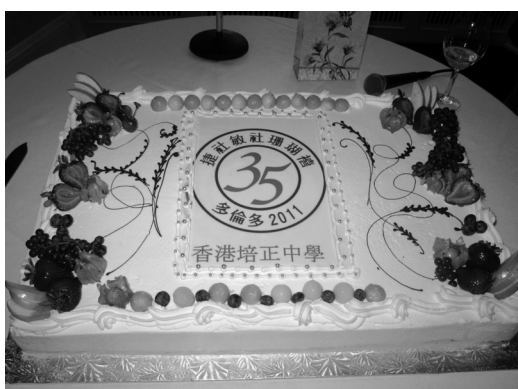
珊瑚禧聯歡大蛋糕