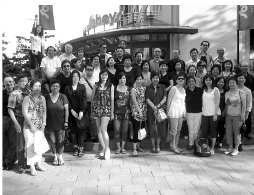
明珠酒家晚宴前留影