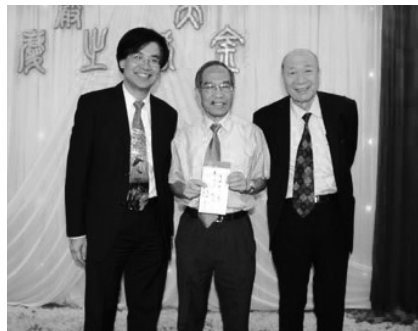
培正教育大樓建設獻金