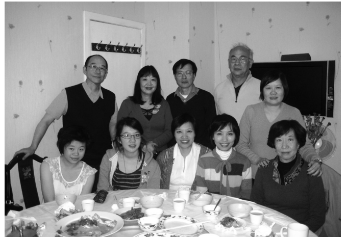
愛丁堡東北菜館晚餐合照

臨去機場前，我們更在佐治廣場參觀了當地的試食會，嘗盡北國美酒及小食，令我們的蘇格蘭之旅更添風彩。