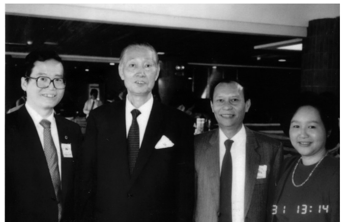
劍潭青年活動中心啟用典禮時與當時救國團團長潘振球（左二）、朱祖明建築師夫婦與左立者青輔會主委簡友新先生合照