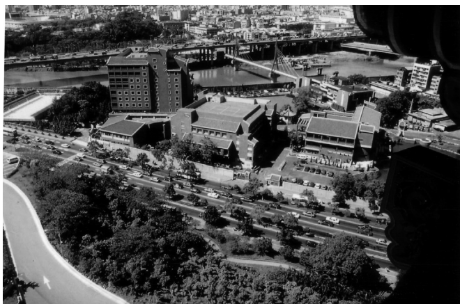
台北劍潭海外青年活動中心——救國團