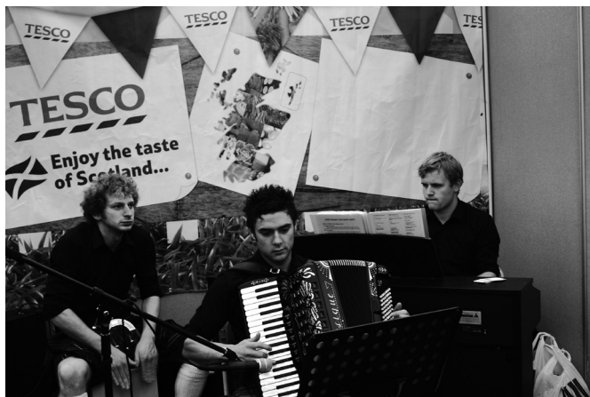
試食會的音樂表演