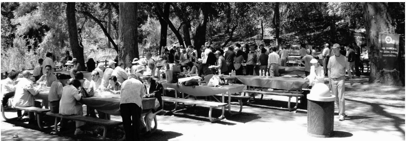
2011年夏季郊遊野餐在Blackberry Farm, Cupertino, CA

只是，今天宣倫兄提出了要記住歷史，倒是提醒了我，要為今次活動記點甚麼。記歷史要包含時、地、人和事件。