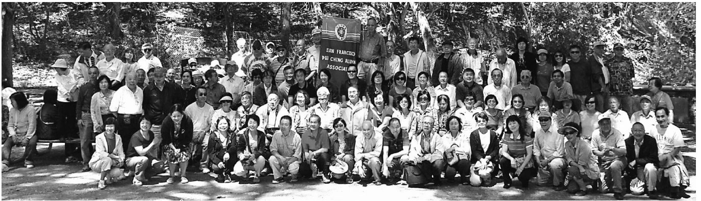
野餐和燒烤區一角

笑聲所阻斷。我停下，腦筋急轉幾轉，方才醒悟，拍下腦袋「真係懵！」不過，我還是祝福這兩位素未謀面的「高佬」和「阿娥」：Grandmother, Grandfather, Congratulations!