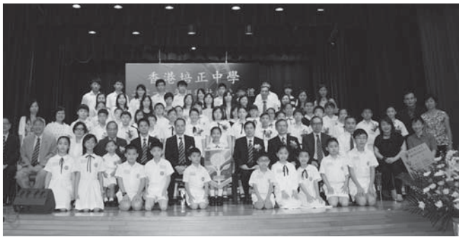
臻社級社職員與嘉賓拍大合照