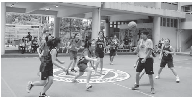
女子籃球隊身手敏捷