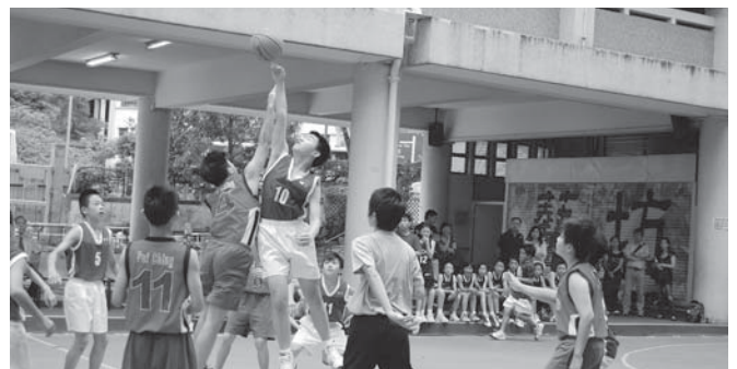
男子籃球隊競爭激烈