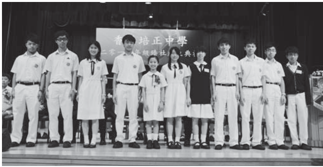
培正中學學生會代表致送賀金