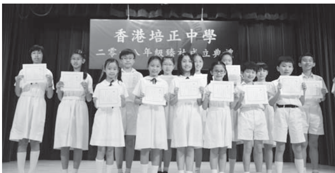
請柬及社旗設計得獎學生