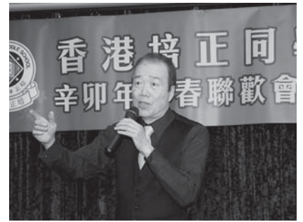
培正的冰哥羅士比