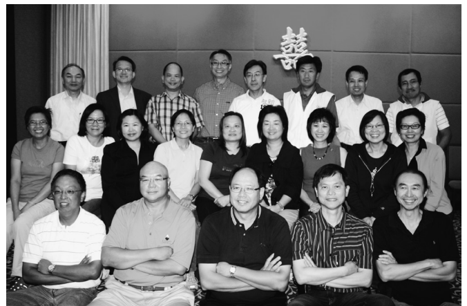
八月廿四日惜別宴大合照