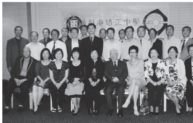
八月廿一日晚宴大合照之一