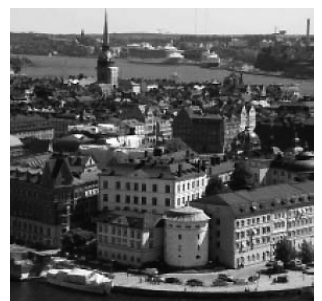
在Stockholm大會堂塔頂之眺

斯堪的納維亞國家，又屬昔日維京族地土之丹、瑞、挪三地，我夫婦三十多年前曾遊訪過，是以郵輪停泊此三地之時，我們都沒有參加船上組織的岸上旅遊團，只二人登岸作漫步自