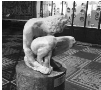
冬宮內展出 Michelangelo 作品「Crouching Youth」