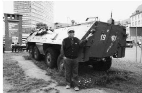
Gdansk 自由之路，昔日共黨用作鎮壓之裝甲車

愛沙尼亞首都 Tallinn 像芬蘭的赫爾辛基一樣，也是無甚看頭，只很多教堂，又有些古城堡遺蹟。後來到了波蘭的葛旦斯克 (Gdansk) 這港口，精神為之一振，我們選擇之登岸遊程，題目就叫自由之路 (Roads to freedom)。是日上午看了葛市舊城，全磚建的天主堂等等，下午便驅車到了上世紀 80 年代波蘭團結工會當年反抗共產政權的地點，這裡有紀念牌匾；擺放當年共黨用作鎮壓之裝甲車，