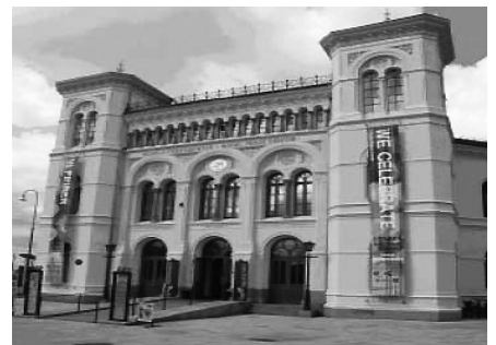
奧斯陸諾貝爾和平獎展覽館