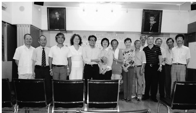
真社全人與王仕中學長 (左五) 合照