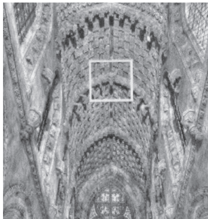
掛件基—白色方格內