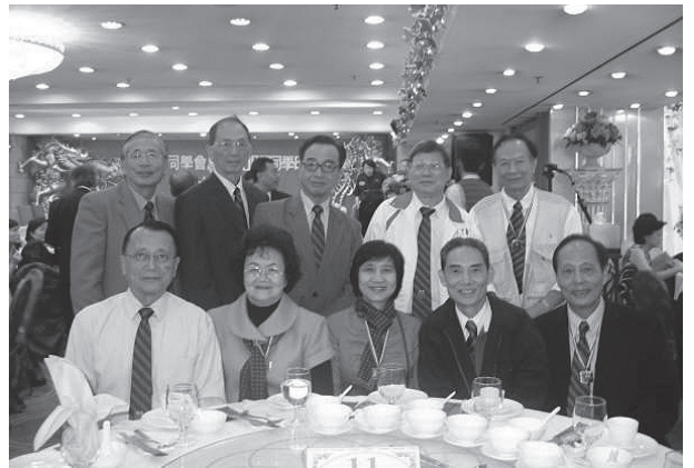
部份輝社同學出席晚宴