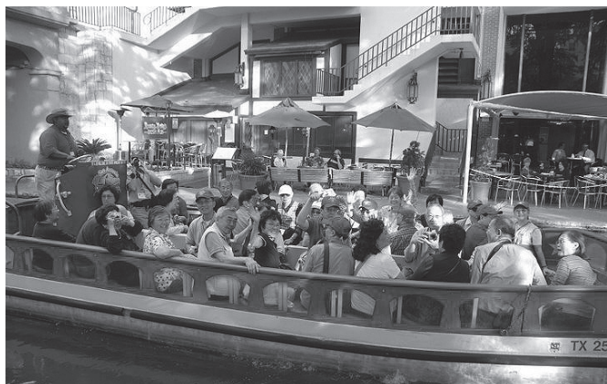
在River Walk 遊覽船上