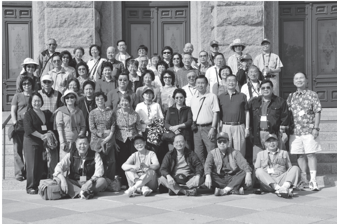
參加歡敘全體合照