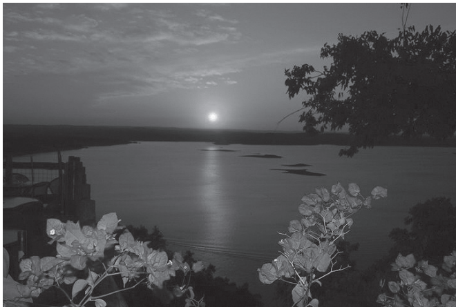
Austin Lake 的日落景色