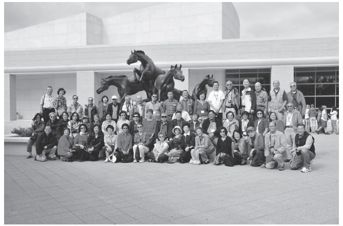
布殊圖書博物館奔馬塑像前的合照

11月23日 歌高唱Talk Talk Talk, Eat Eat Eat, View View View, Play Play Play, 忘憂的吃喝玩樂十多天，加上五十多年的友情重溫，真的是依依不捨啊！