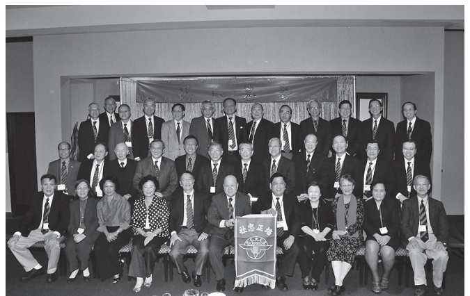
參加大歡宴全體忠社同學