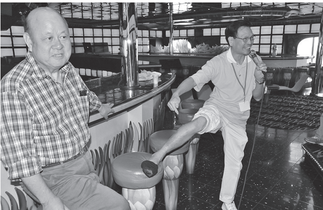
天蠶腳—銳社廿立人的天蠶腳難倒了忠社五名醫