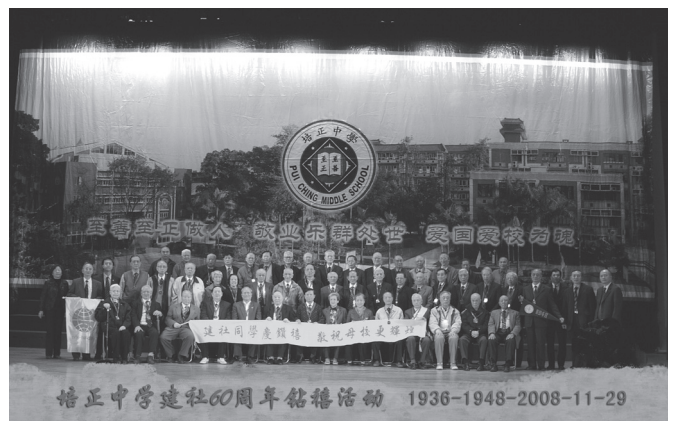
在廣州培正中學鑽禧慶典