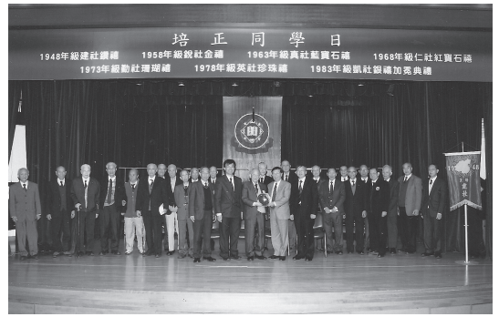
香港培正同學會向建社送紀念牌

這次重臨澳門培正，感覺培正在澳門教育界方面是站在首位的，學生接受一條龍式教育，由小學一年級直到高中三年級，都在培正學校內一氣呵成十二年的全部教育，全校學生達三千多人。校內在建的120周年紀念大樓工程已經平頂，2009年中建成投入使用後，十層高的大樓將會向學生提供更理想的學習環境，屆時迎接120周年校慶，一定又有一番熱鬧景象。 建社香港同學會報導