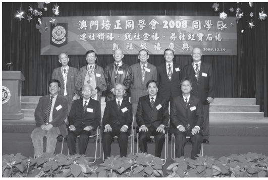
在澳門培正中學鑽禧慶典