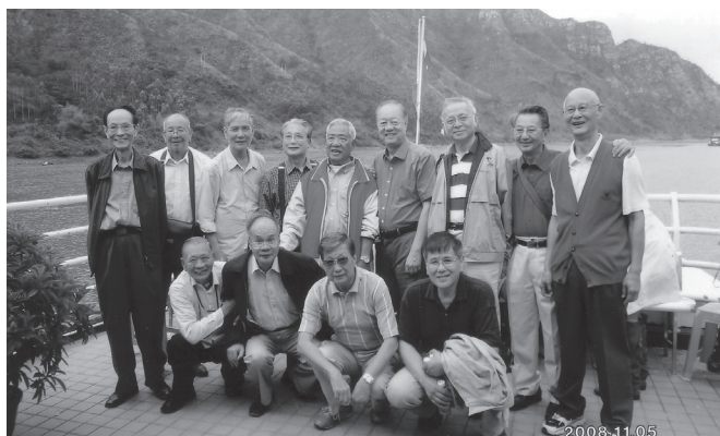
滿懷喜悅暢遊北江