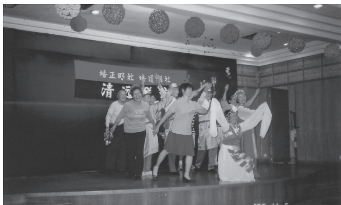
晚會舞台上青春再現