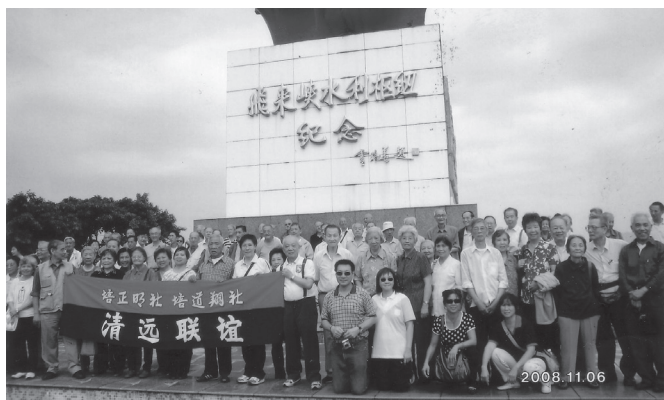
飛來峽來個合家歡