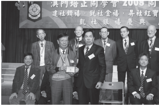
澳門培正同學會向建社送紀念牌