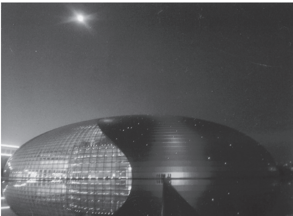
國家劇院夜景正好跳到月圓在上空,攝於2008年10月17日