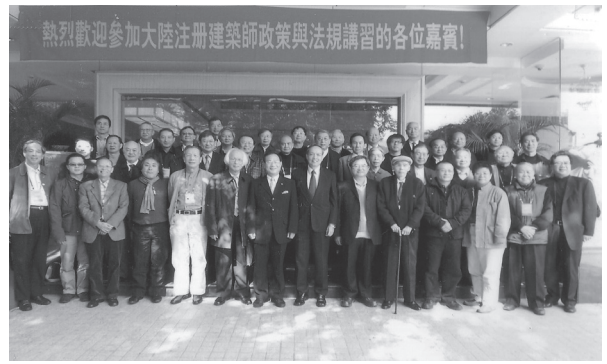
2008年11月27至30日經赴京商談三次之後有了具體結果。台灣38名知名資深經挑選及提名由 聯會(建築師公會 聯會)參加由大陸首次舉行之「大陸註冊建築師政策與法規講習」