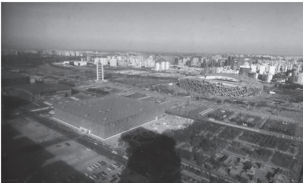
北京2008年8月舉行世界OLYMPIC,10月在其旁剛完成之盤古大觀上攝取之全景