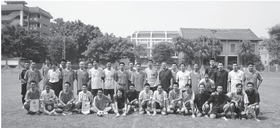
穗港澳三地運動員大合照