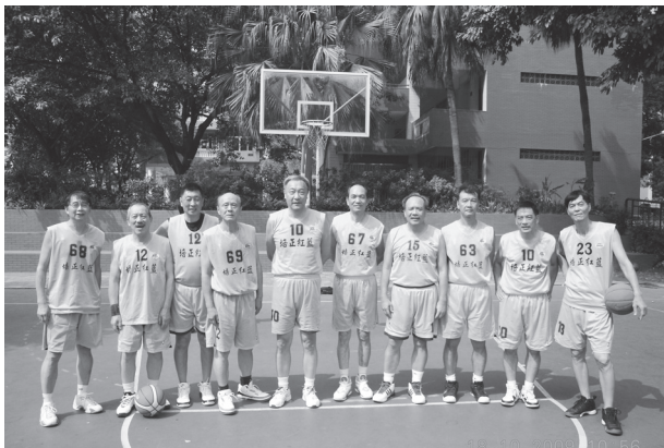
香港培正紅藍校友籃球隊合影於東山校園