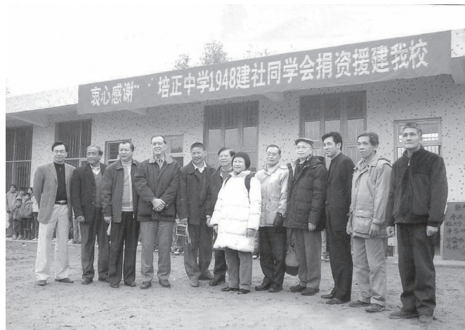
廣東省懷集縣有關領導及校長和我們在李坑小學新校舍前合照