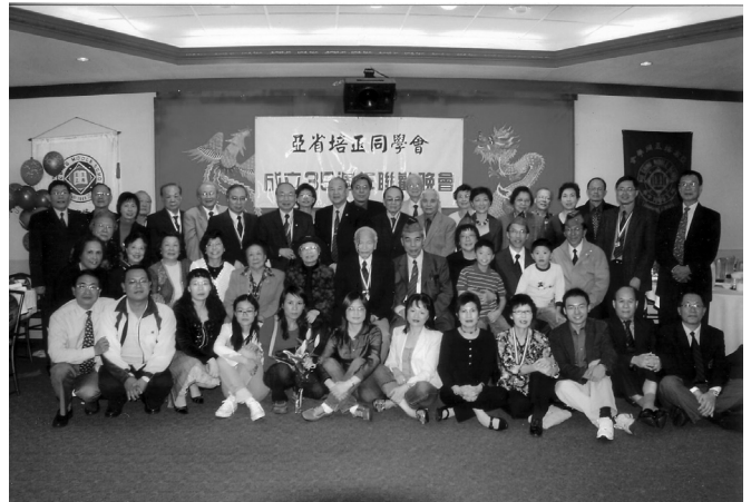
亞省培正同學會校友與來賓合影