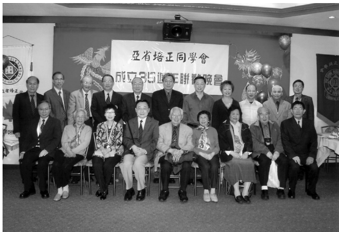
亞省培正同學會職員與卡城培正校友合影