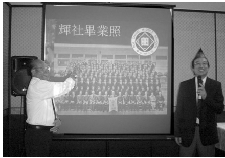
嚟！我當年幾英俊！而家都唔差架！