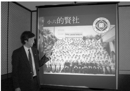
小六信，《何老虎》做班主任，係唔係回味無窮！