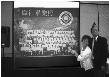
看看！這是我啊！笑得多開心！