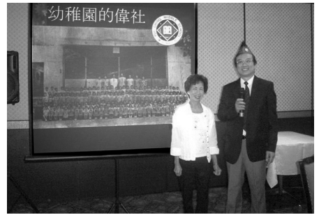
李少君又拍幼稚園畢業照了