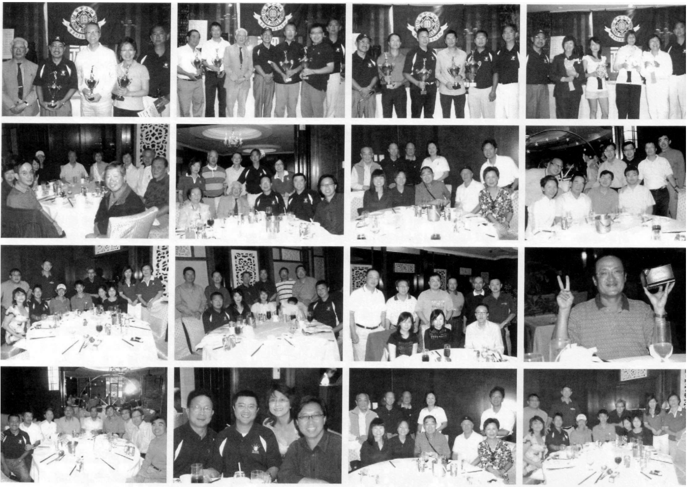
安省培正同學會2007年度哥爾夫球大賽晚宴及頒獎