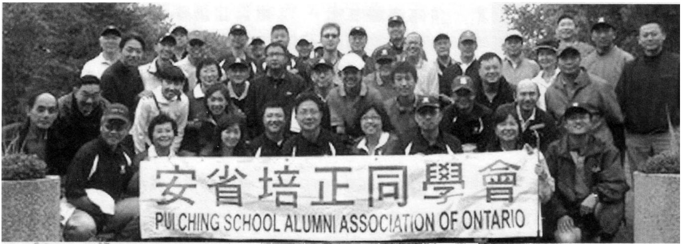
安省培正哥爾夫球大賽