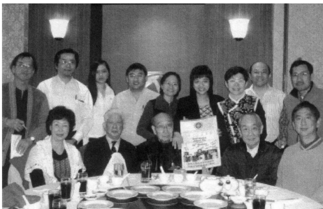
巫傑學長九十二大壽合照