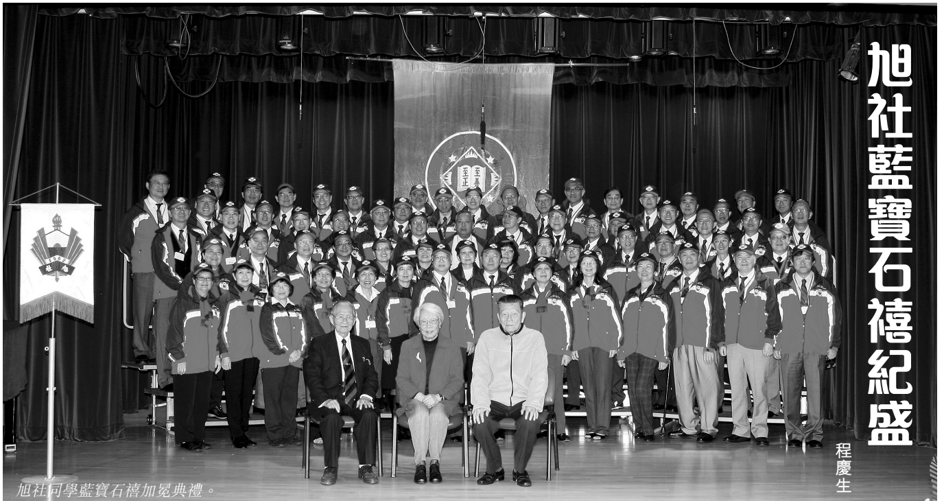
旭社同學藍寶石禧加冕典禮。