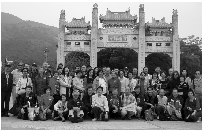
旭社同學遊大嶼山寶蓮寺