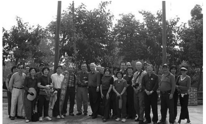
旭社同學在珠海點燃爆竹誌慶