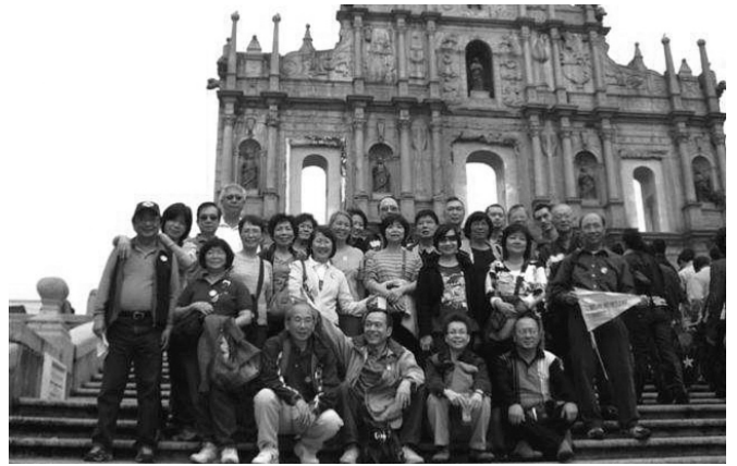
旭社同學遊澳門大三巴教堂遺址

至此完成為時十一日之慶祝離校四十五年節目。同學辛勤的籌劃、時間和精神無私的奉獻，以及慷慨的贊助，眾志成城地致令這次慶祝活動獲得空前成功，各人俱感到非常興奮。大家對數十載的友情尤其珍惜，也覺得應該好趁此時，盡情享受金色年華也。