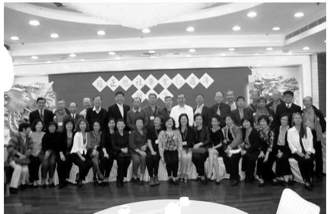
謝師宴上旭社同學合照