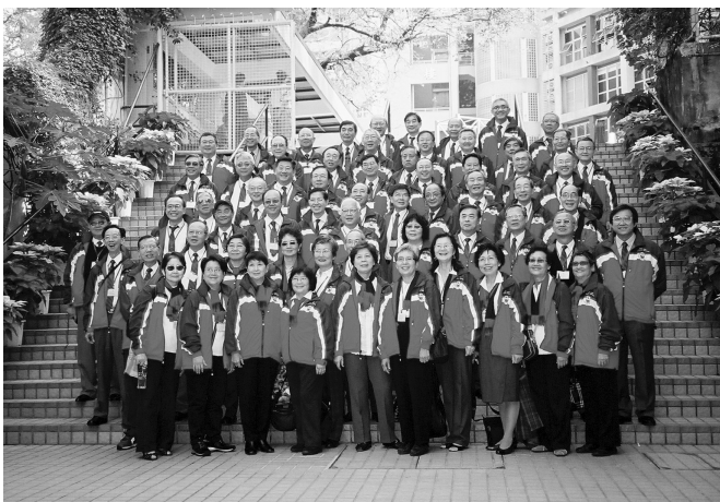
旭社同學在母校校園合照