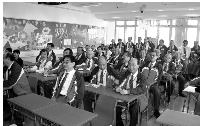
旭社同學重溫學生時代舊夢