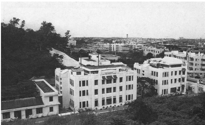
小學部（前座、中座兩樓三層樓，其中的二、三樓作宿舍用）