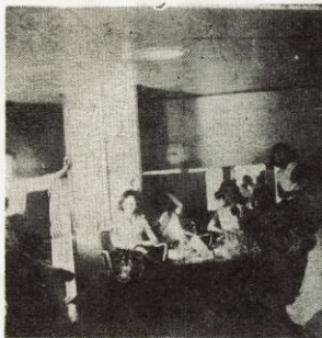
↑ Subterranean Party?