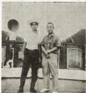
↑ 親親密密，留為紀念。