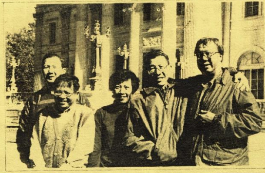
善社五友---暢遊MARBLE HOUSE 後合照