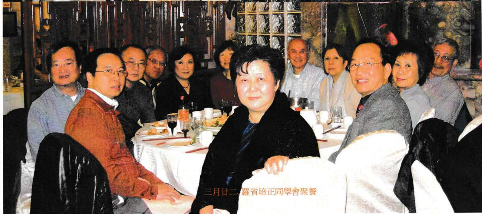
三月廿二, 羅省培正同學會聚餐