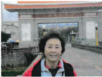
惠翠在中韓邊界的中國關口

長白山後的重點是圖門的中韓交界，圖門有一象徵性朝鮮民族村。一般人的生活都是很苦，一家的入息約一萬人民幣。東北有出產人參(白參)。在旅遊區出售的都是韓國的紅人參。是真是假不得而知了。