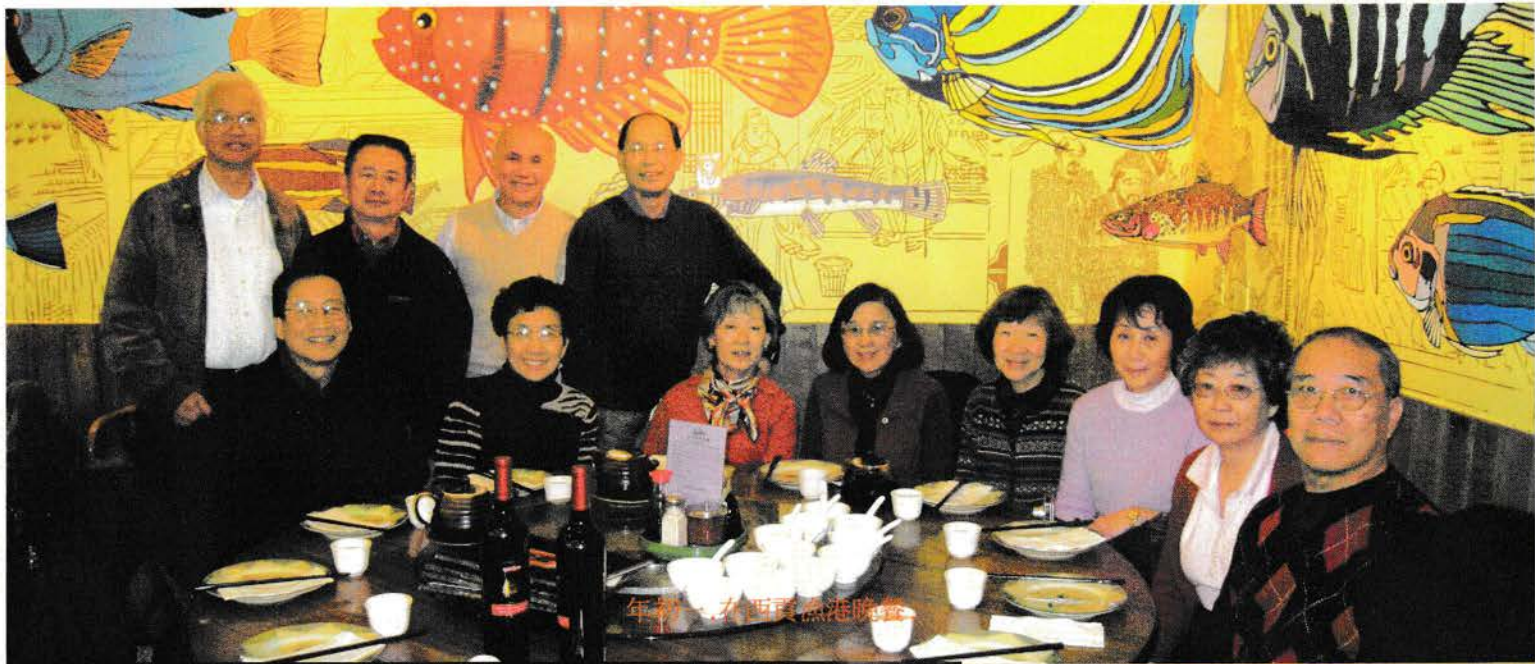
年初一在麗晶酒店晚餐