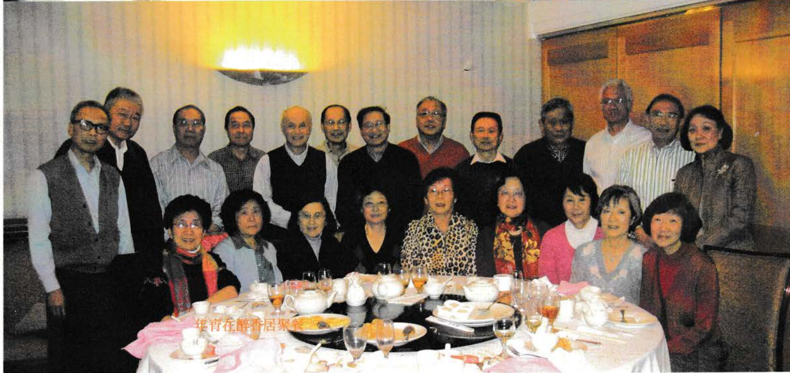
年宵在醉香居聚餐