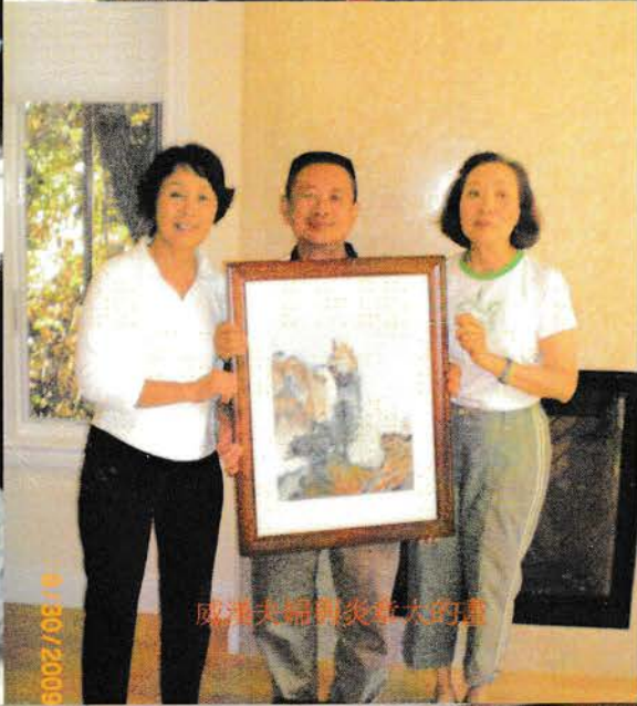
威洋夫婦贈炎紅大的畫