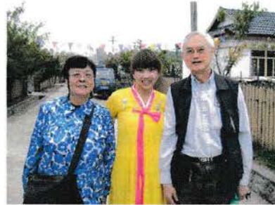
玉安夫婦在朝鮮族村

這是丹東市的主要遊覽點。最近中國國務院總理溫家寶訪北韓，簽了合約要在丹東市建一鴨綠江大橋，速進中韓的貿易。如不會在丹東市一遊，也不會理解這政治合約的重要。一般而言，東北比中國的發展城市，甚至於旅遊地區落後二十多年。沿途路上旁都種滿玉米，大部份仍是農業為主。一如抗日時代的歌曲贊揚的東北，到今天東三省東面邊界仍是高粱肥大豆香。在丹東稍逗留後便向北行去桓仁。晚上八時許才抵達。第一天的行程從早上七時半至晚上八時，超過十二個小時的車程，相比過去的中國旅遊，這是辛苦多了。在中國沒有時間地區。因東部已旁韓國，五時已開始天黑了。在漆黑的農村小路上趕路。我心想會不會迷路。當司機停車去農家問路時，我感覺迷路機會更大了。幸而還在八時許抵達旅店。