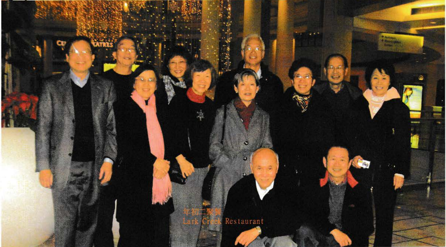
年初二聚餐 Lark Creek Restaurant