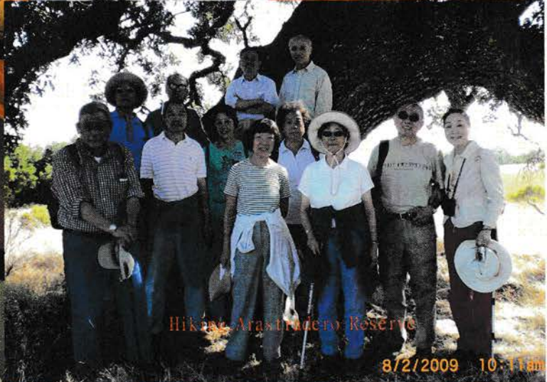
Hike at Arastazero Reserve 8/2/2009 10:11 am